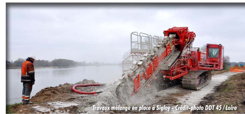
Travaux mélange en place à Sigloy